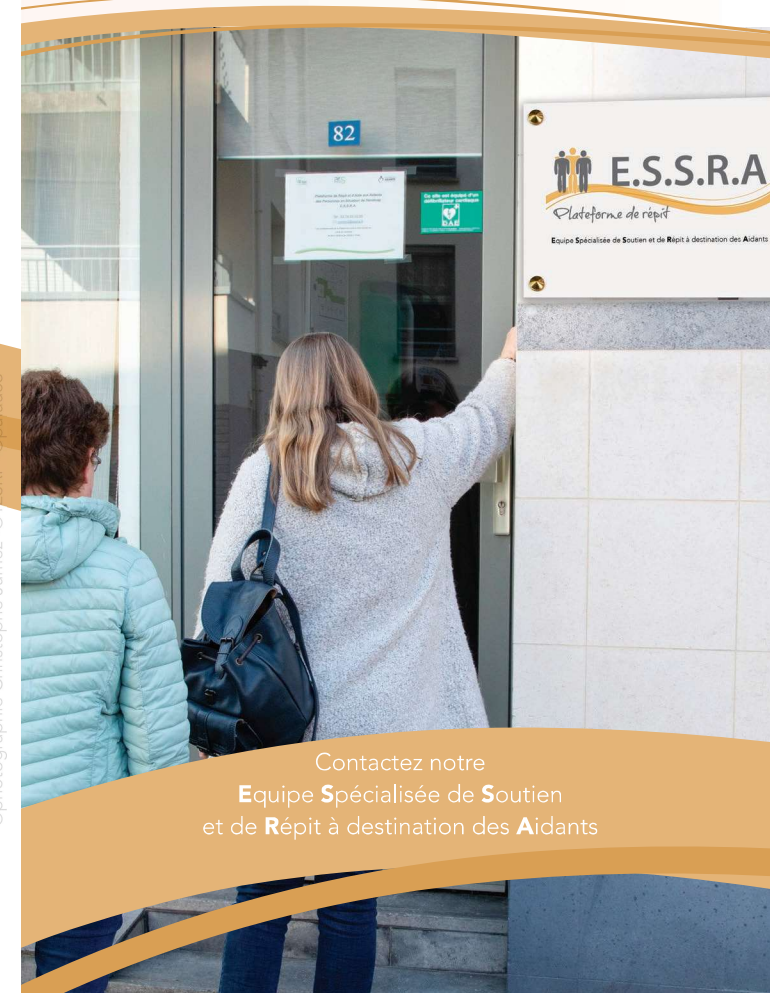
01 23 RF - 03 pas au 83

Vous recherchez des solutions de répit, un soutien, un accompagnement ?