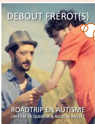
Debout Frérot(S) - RoadTrip en Autisme film documentaire / 110min / 2022

Dans le cadre de la journée mondiale de sensibilisation à l'autisme, l'Association « Les Patates Chaudes » membre d'Autisme Ressources propose une projection : Mardi 4 Avril à Wasquehal (59) : « Debout Frérot ! »