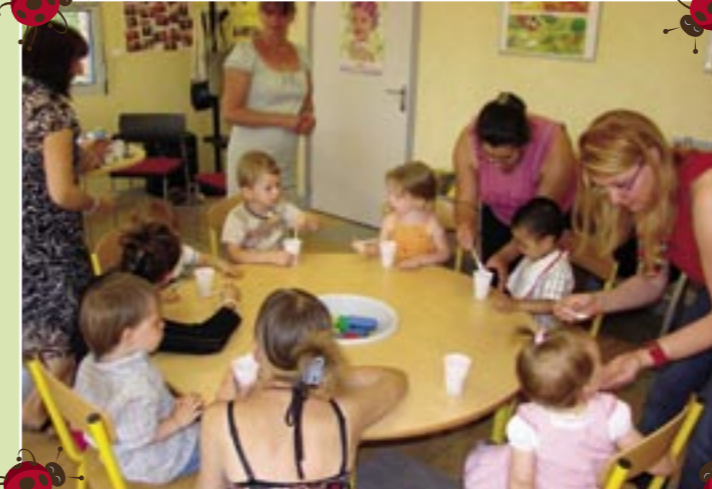
" Les petites coccinelles " accueillent enfants et parents durant la période scolaire, les jeudis de 13h30 à 16h30 et les vendredis de 8h30 à 11h30. L'équipe est composée de huit personnes : un animateur du Centre Social, une animatrice petite enfance, une animatrice famille, la directrice du Centre Social, la coordinatrice du Programme de Réussite Educative, le coordonnateur du Réseau d'Education Prioritaire, un travailleur social de la CAF, une puéricultrice de la Halte Garderie.

contact : Lieu passerelle "les petites coccinelles" au centre social Kaleïdo, 8 rue du Maréchal Leclerc, 62221 Noyelles-sous-Lens - 03 21 70 90 20