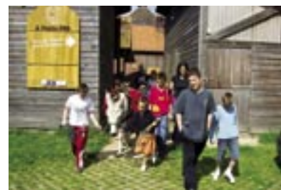
Un séjour au vert... des familles accueillies par l'association A Petits Pas à Ruisseauville

" On a vu nos enfants différemment de chez nous " ■ ■ ■