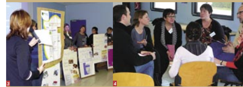
1 Les représentants des institutions partenaires des REAAP - le Conseil Général, l'Education Nationale, la FédéCAF - réaffirment le nécessaire soutien à la parentalité ... 2 Les co-animateurs sont à l'honneur... 3 Illustration des actions d'un comité d'hyperactifs : celui du Boulonnais.... 4 Des ateliers pour échanger sur la notion de violence....

La journée départementale des REAAP, rencontre annuelle qui réunit professionnels, associations et partenaires divers s'est tenue à Olhain le 31 janvier dernier.