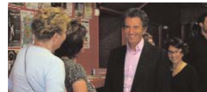
l'occasion de sensibiliser nos élus...