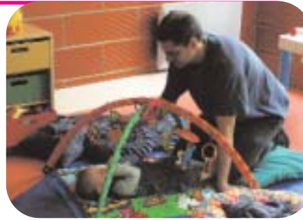
l'occasion de se faire une sortie entre père et fils...

" Etre parents dans le Boulonnais " et pouvoir connaître ce qui est proposé en la matière sur le territoire, tel était l'objectif du comité local REAAP