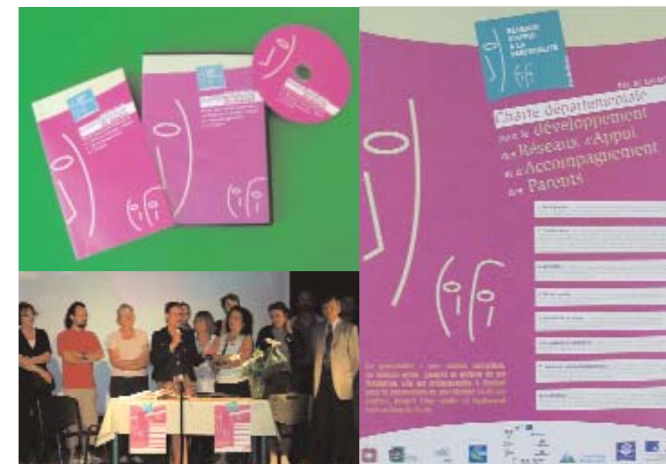
dernier signataire en date de la charte, le centre social Espace Carnot du Portel lors de la semaine "Famille à la une", le 9 juin 07 (voir article p 3)

Sortie du DVD "La charte départementale en images". Un outil pédagogique au service de la "cause des parents". Nos 8 valeurs illustrées par des actions menées sur l'Audomarois.