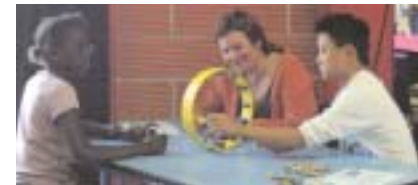
l'occasion de découvrir de nouveaux jeux...

Le samedi 9 juin constituait le point final de ce temps fort avec un pique nique géant au Centre Socio-culturel de Wimereux. Au programme : des jeux pour parents et enfants mais aussi le lancement officiel du site Internet parentalité du Boulonnais et la signature de la charte départementale des REAAP par le centre social Espace Carnot du Portel. Une organisation réussie avec un bilan plus mitigé quant à la participation des familles... fête des écoles oblige !