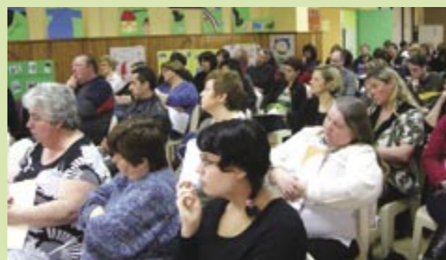
Un public venu en nombre pour cette journée régionale des Universités Populaires de Parents

Le 7 mars dernier, à Oignies, s'est tenue la journée régionale des Universités Populaires de Parents (UPP) du Nord et du Pas-de-Calais*.