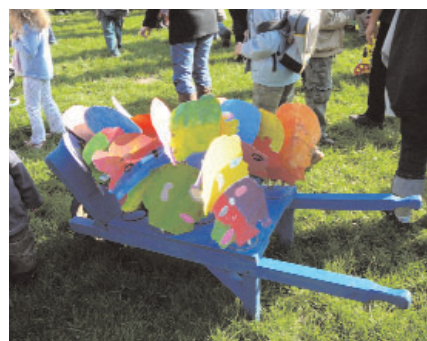
"familles en brouette", une oeuvre collective exposée lors d'un événement culturel à Bomy