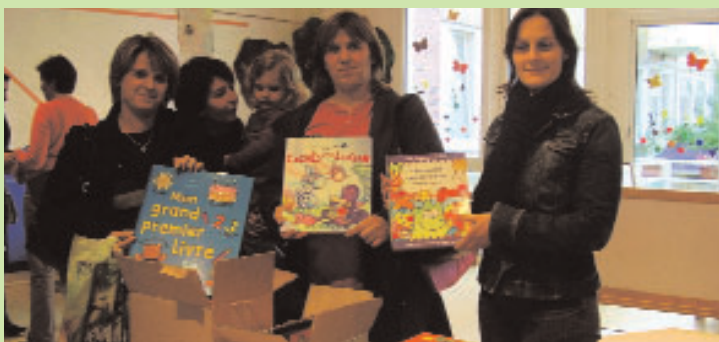
des parents fortement impliqués dans cette action autour du livre

Difficile pour certains parents de prendre du temps avec leurs enfants autour du livre ou d'aller à la bibliothèque... A la suite de ce constat, la halte garderie du Centre Social CAF d'Etaples a élaboré le projet