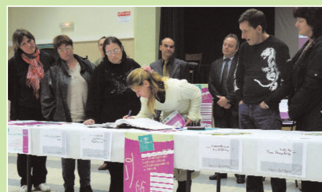
Les parents des 5 structures signataires sont venus en nombre

Très investis dans la préparation de cet événement, ils ont, eux aussi, signé le Livre d'Or de la Charte des REAAP